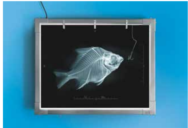
Beste Prognosen für ein entspanntes Leben.