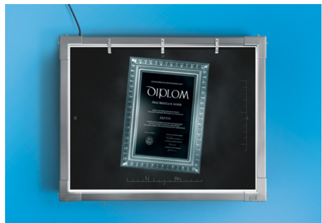
Beste Prognosen für Ihre Zukunftspläne

Beispiel einer vorausschauenden Risikoplanung für einen jungen Arzt*: